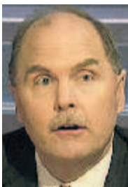
GM:s vd Fritz Henderson.

Normalt sett hade en utbetalning till ett dotterbolag inte skapat de här problemen. Interna transaktioner är som att skicka pengar till sig själv. Men Saab är under rekonstruktion.